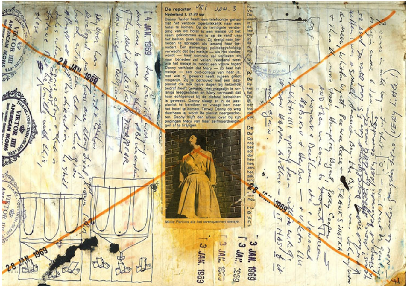
(Dag-/schetsboek 24, blz. 3)

In 2009 kwam de '50th Anniversary Edition' van de film uit en nog steeds heeft de gemiddelde Amerikaan de jonge Millie Perkins voor ogen als het over Anne Frank gaat.